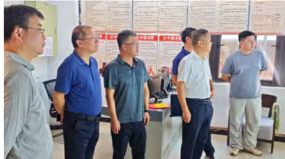
9 月 23 日，省市县三级文旅部门对四季花海景区开展国庆节旅游接待准备工作检查