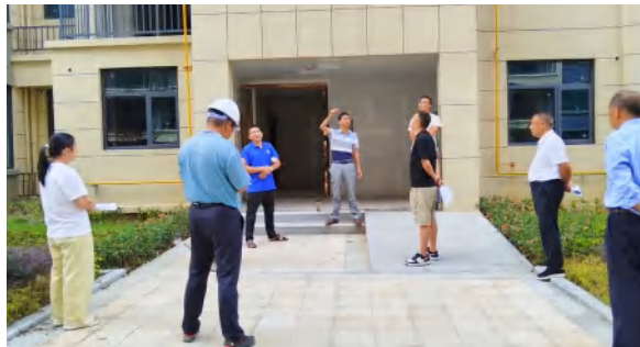
9 月 29 日，花海置业组织九龙湾 A 区 9、10 号楼交房验收