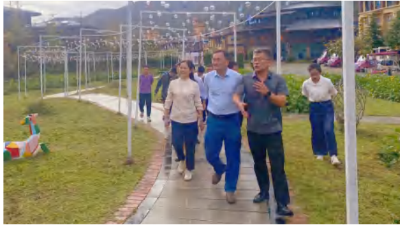
9 月 25 日，黄冈市人大常委会领导到四季花海调研文旅康养产业融合情况

九龙湾温泉度假公寓酒店：66 间温馨舒适的客房素雅恬淡，自带 24H 私家温泉泡池，还有整洁雅致的客厅、配套齐全的设备，让你从踏入公寓开始，就能感到安心自在。旅行中的温暖之家在这里，可以尽情享受专属于你的闲适。花海里酒店：高低错落的位置，古朴舒适的外墙，好似散落在森林里的树屋，最适合和朋友一起拍照打卡。在这里，你只管尽情享受阳光与微风的拥抱，躺着日出与日落，旅行的舒适放松感恰到好处。