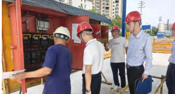
10 月 7 日，武穴市应急中心检查武穴天地项目安全设施运行管理情况