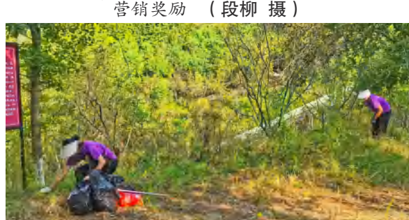
铭先公司红培部维护红色游线环境 （张技 摄）