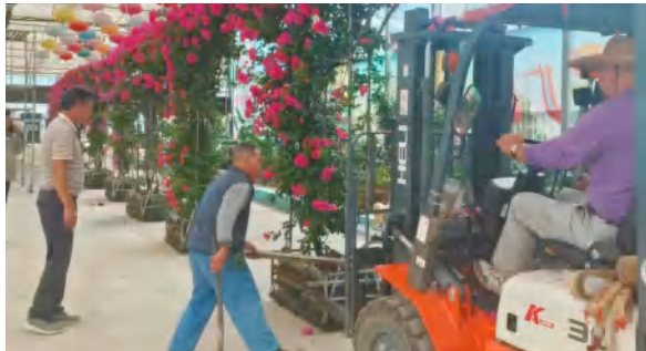
9 月 25 日，景区园林部抓紧花立方室内花卉布展迎国庆