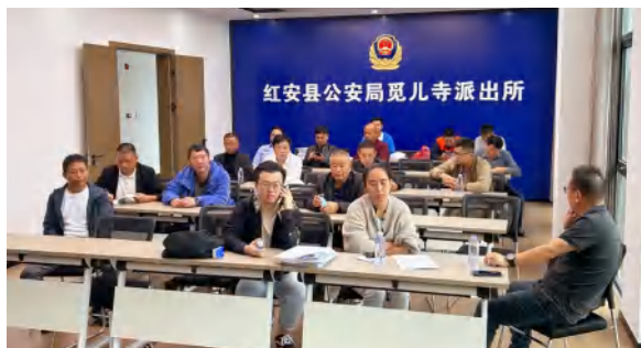
9 月 24 日，红安县公安局觅儿、高桥派出所建设项目竣工验收