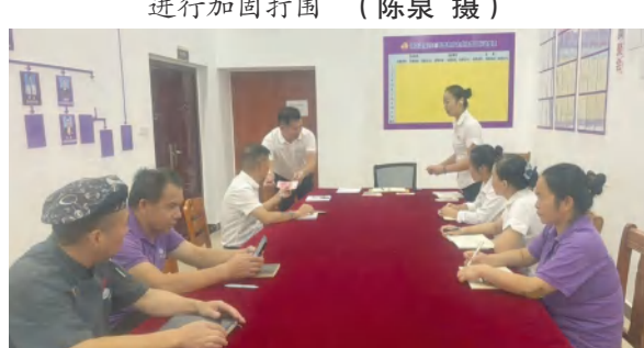
四季花海酒店运营中心颁发 OTA 营销奖励