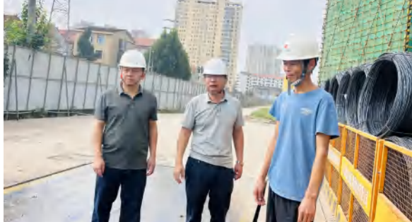
10 月 1 日，武穴市住建局在武穴天地项目进行节日安全生产检查