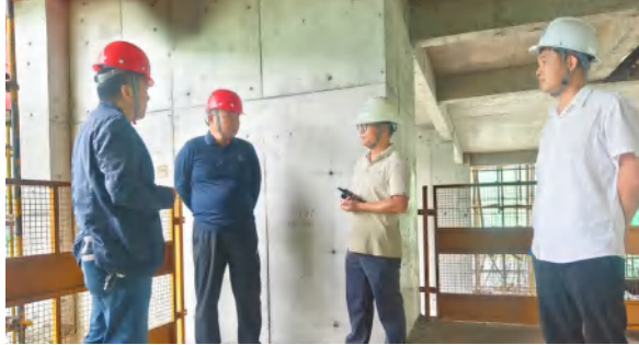
9 月 24 日，黄冈市安全生产“铁拳行动”小组现场检查武穴天地项目