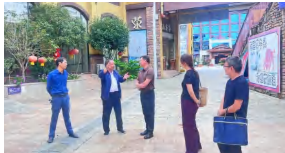
9 月 24 日，英山县卫健局、县医院进行九龙湾康养项目用房意向现场考察