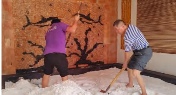
英山花乐汤温泉清整功能设施迎接秋冬旺季开放