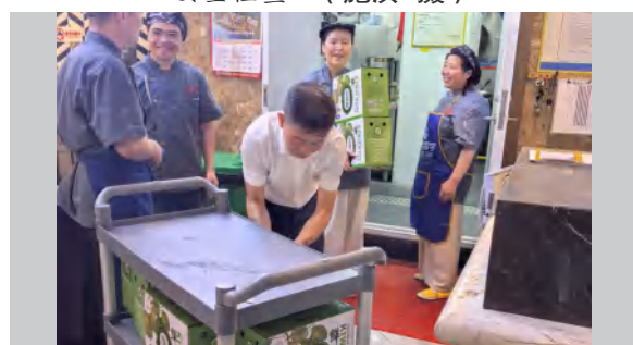
9 月 25 日，四季花海公司为员工发放中秋节日福利品