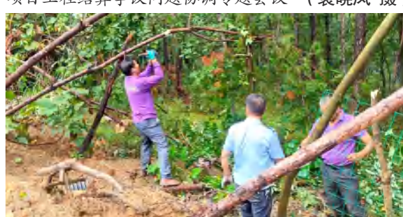
9 月 24 日，安保部对四季花海景区围栏进行加固围网