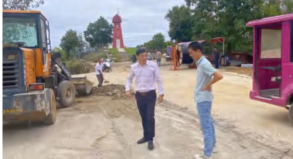
9 月 19 日，四季花海公司领导检查景区旅游道路提档升级工程进展及质量情况