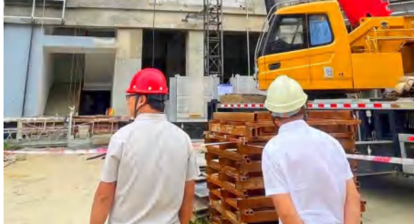
9 月 18 日，红安县人民医院新院区二期项目施工升降机顺利拆除