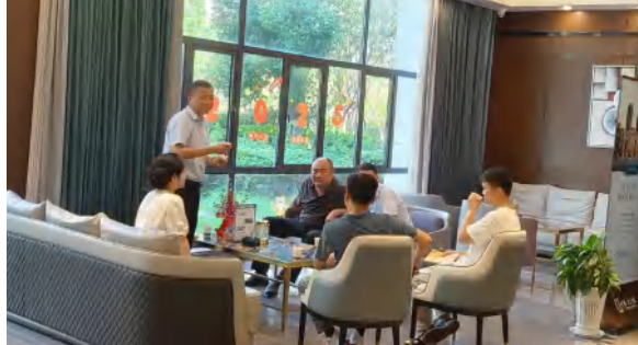
9 月 16 日，团风县住建局领导到中泰大公馆项目调研居民购房政策落实情况