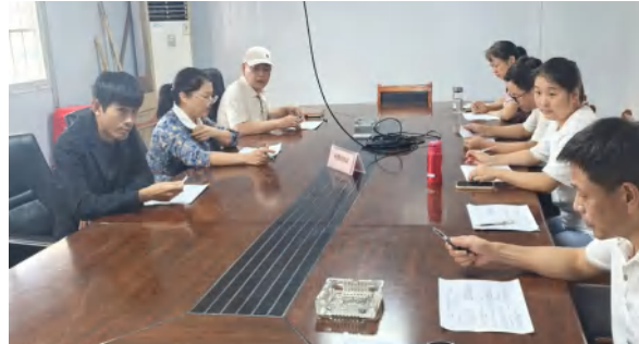
9 月 26 日，建筑业部组织召开湖北金港汽车公园项目工程结算争议问题协调专题会议