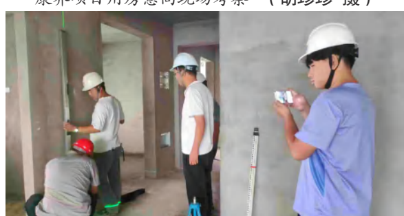
9 月 18 日，武穴天地项目三方检测